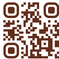
Фото блюд можете посмотреть на нашем сайте